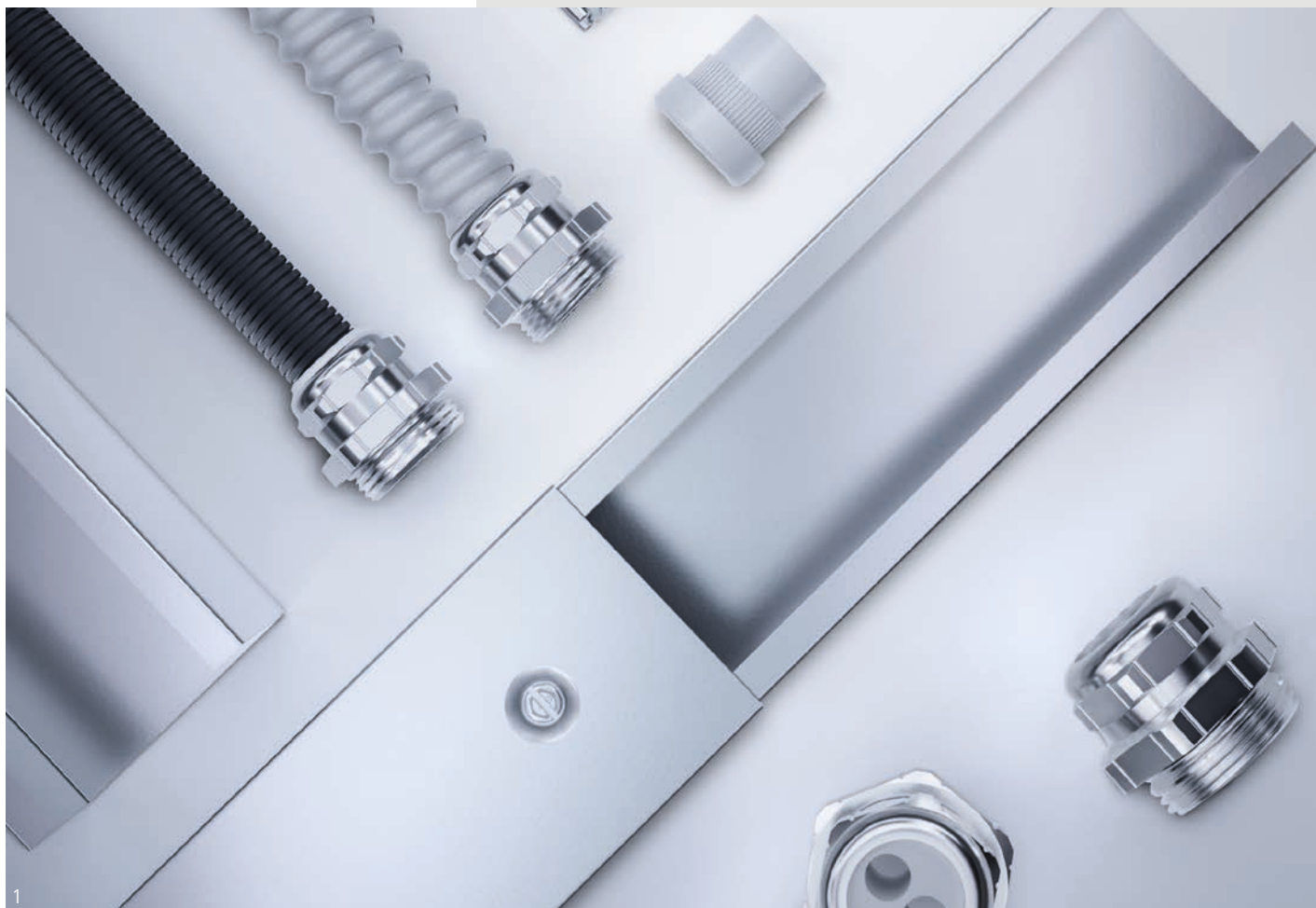
Abb. 1 – PFLITSCH Produktportfolio Fig. 1 – PFLITSCH product portfolio