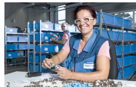
Jetzt bei myPFLITSCH anmelden