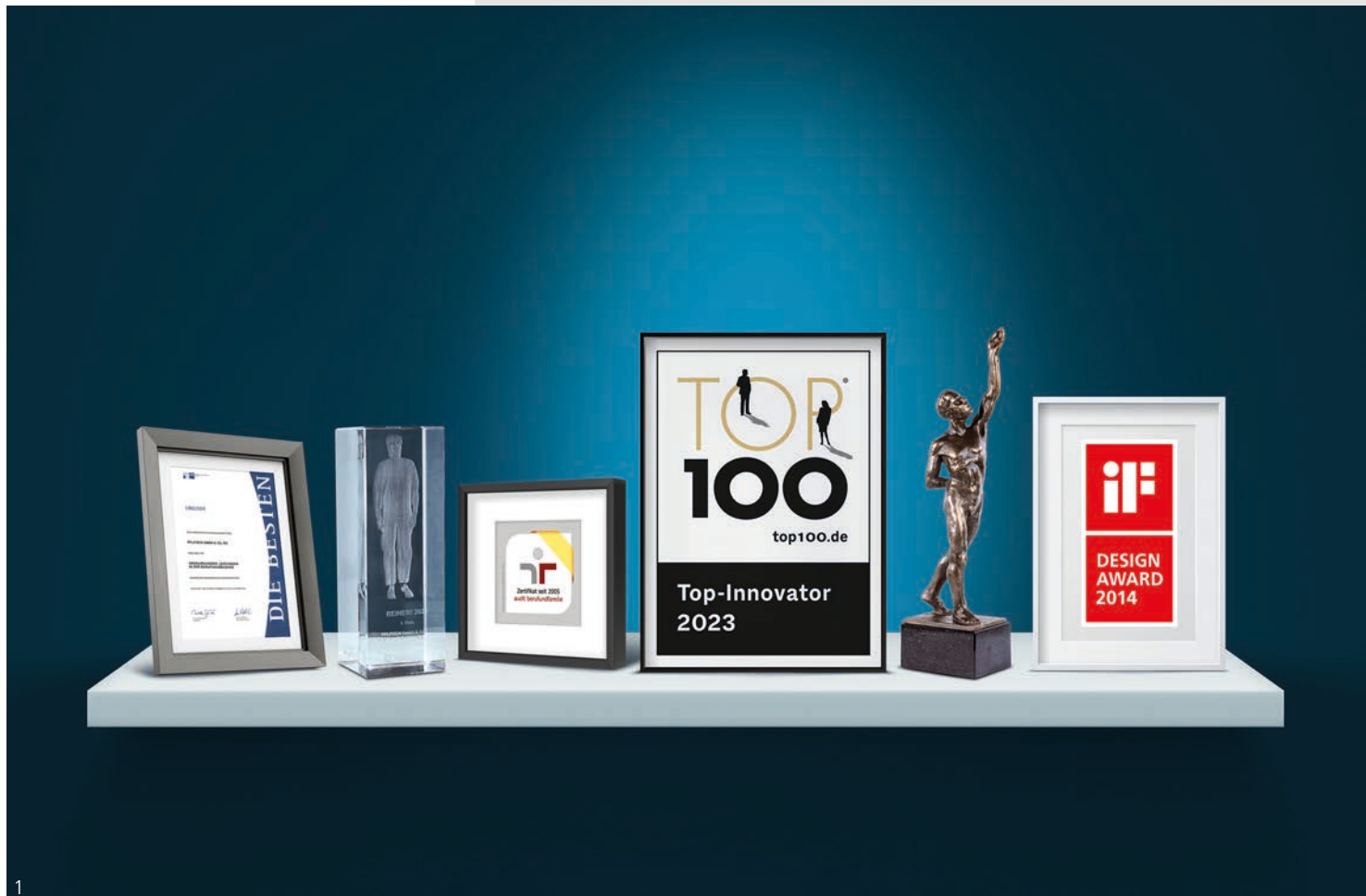
Abb. 1 – Zahlreiche Auszeichnungen unterstreichen unsere Leistungs- fähigkeit Fig. 1 – Numerous awards underline our performance

Strong performance that makes a difference