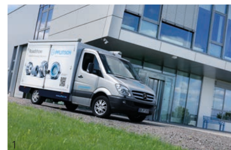
Abb. 1 – PFLITSCH Showfahrzeug Fig. 1 – PFLITSCH show truck