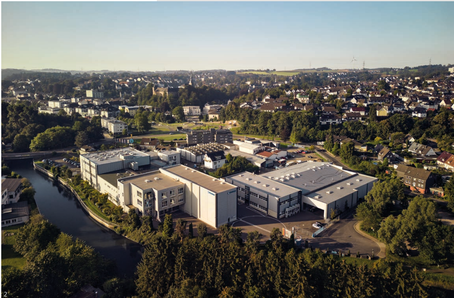
Abb. 1 – Werk II – PFLITSCH Kompetenzzentrum für Kabelkanäle Fig. 1 – Plant II – PFLITSCH centre of competence for cable trunking