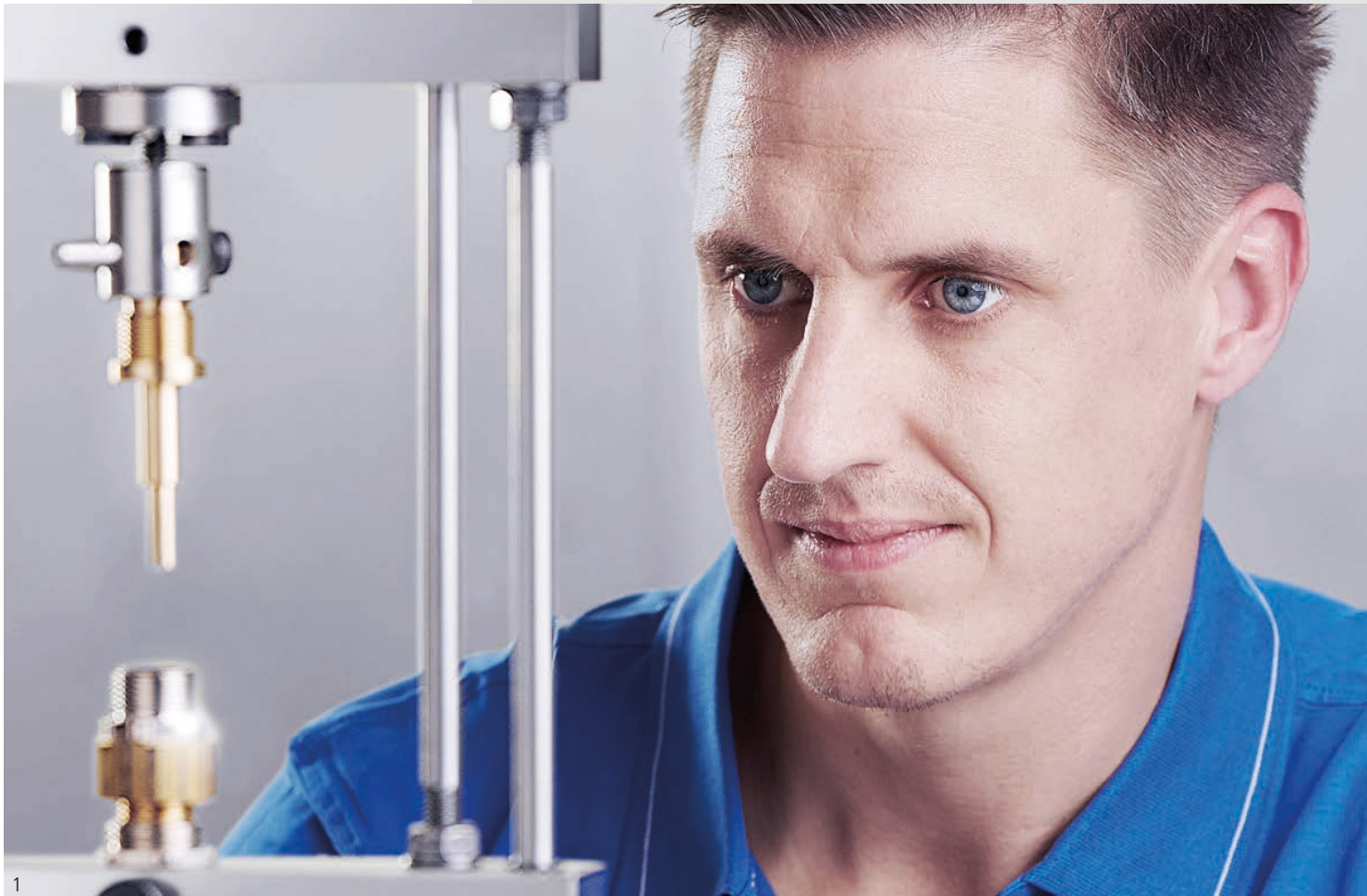
Abb. 1 – Im PFLITSCH Labor werden Kabelverschraubungen umfangreich geprüft Fig. 1 – Cable glands are extensively tested in the PFLITSCH laboratory.

Strong brands for the highest quality standards