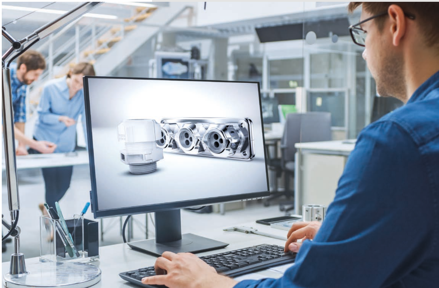
Abb. 1 – Per Mausklick auf den PFLITSCH CAD-Bauteilekatalog zu- greifen Fig. 1 – Click your way through the PFLITSCH CAD component cata- logue

Everything from a single source – from consulting to customised product solutions