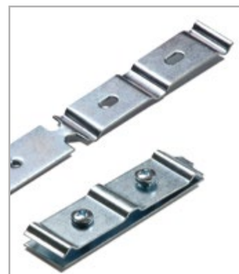
Art. 110 - DoppelVerbindungsplatte