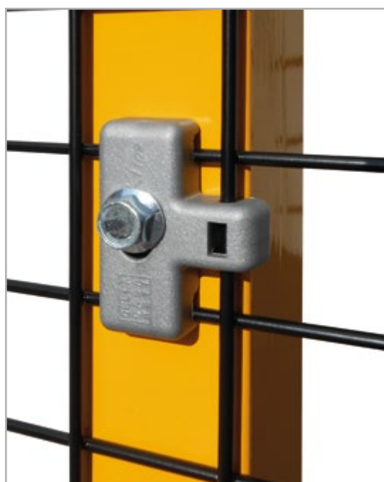
art. 119 - Klips Platte

Die Klips Platte (Patent angemeldet) ermöglicht die frontale Montage des Gitterelements mit Maschen 40x40 an einer Tragstruktur. Die Klips Platte wird an einem Draht des Elements fest geklemmt bleibt damit unverlierbar verbunden, wie es die geltenden Vorschriften verlangen.