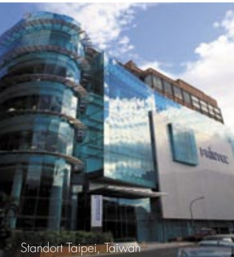
Standort Taipei, Taiwan