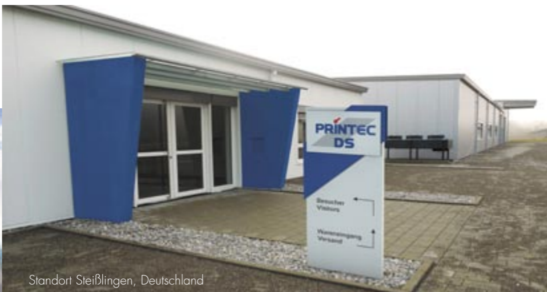
Standort Steißlingen, Deutschland

EN ISO 9001 Qualitätsmanagement System EN ISO 14001 Umweltmanagement System (TW) EN ISO 13485 Qualitätsmanagement System – Medizintechnik (TW)