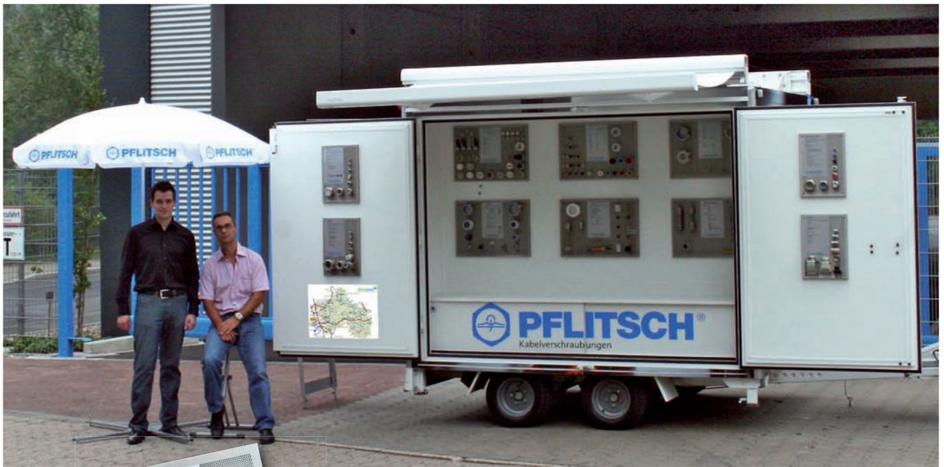
Ansicht „Steuerbord“ mit 10 Mustertafeln

Wir präsentieren Ihnen vor Ort, in Ihrem Werk, das System PFLITSCH mit offenen und geschlossenen Kabelkanälen, innovativen Kabelverschraubungen aus Metall und Kunststoff, kostensparenden Werkzeugen und Kleinmaschinen sowie unser Dienstleistungsangebot.