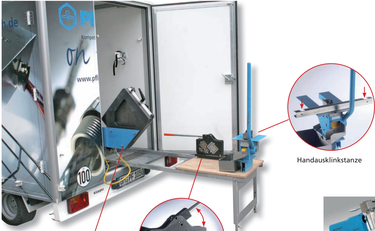
Ansicht „Heck“ mit 7 Geräten.

individuelle Lösungen für Anwendungsfälle moderner Kabelführung.