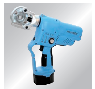
MatchClamp™ Presswerkzeug, elektrohydraulisch