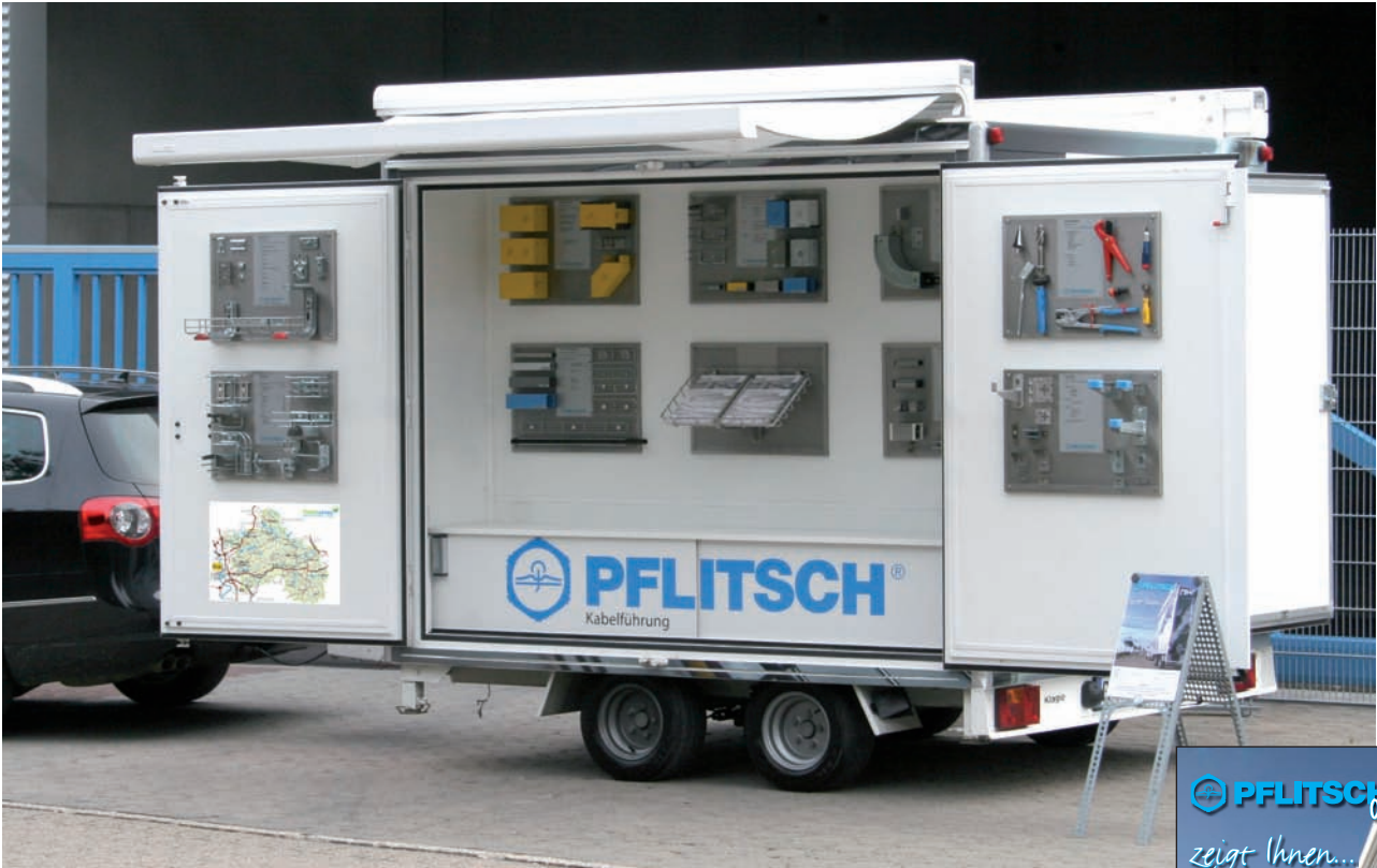
Ansicht „Backbord“ mit 10 Mustertafeln