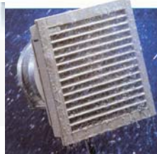
IP 55 Filterlüfter

„Klack und sitzt!“ und spritzwassergeschützt