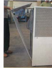
Center-Click-Haube zur einfachen Wartung!