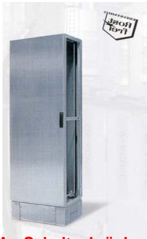
VA - Schaltschränke