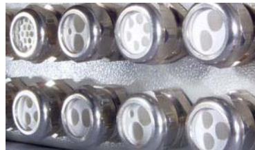
VA – Verschraubungen