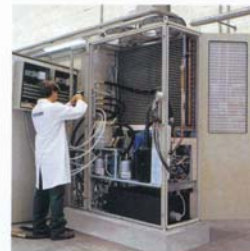
Kühlgeräte aus Edelstahl